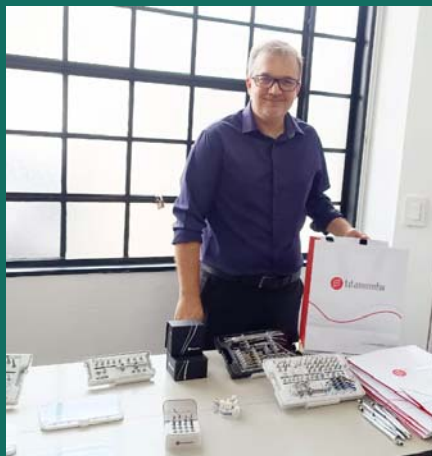
Nelio Franklin da Titaium FIX