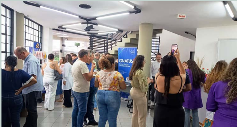
No intervalo, muita troca de energia e registros .

Nesta edição e na de janeiro, matérias sobre as tematicas abordadas.