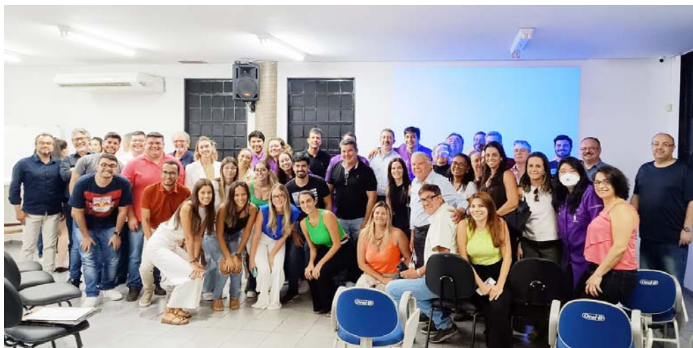
Ao termino de uma das plaestras, foto com professores e participantes