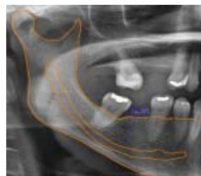
Imagem 3 - (Panorâmica) Corte segmentada de radiografia panorâmica do lado direito da mandíbula.

Na imagem 3, visualizamos a região posterior direita da mandíbula com mensuração (em azul) e Traçado Anatômico (em laranja). Enquanto que a imagem 4 refere-se a mesma re