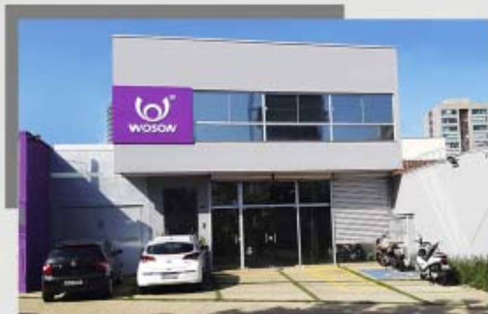
Escritório Woson Latam - Ribeirão Preto, São Paulo

Em 2017, como parte do projeto de expansão da marca, é fundada a WOSON LATAM no Brasil, as filiais no México, Rússia e Índia, o lançamento do revolucionário modelo TANZO TOUCH 2.0, compatível com o Sistema Purificador de Água por Osmose Reversa (WPS) e a Linha TANVO. Lança-se a TANDA COLOR, uma autoclave gravitacional diferenciada da Classe N, em conformidade com a Norma Internacional EN13060:14 para atender um mercado carente por esterilizadores mais simples, porém de QUALIDADE SUPERIOR, sucesso no mercado latino americano.