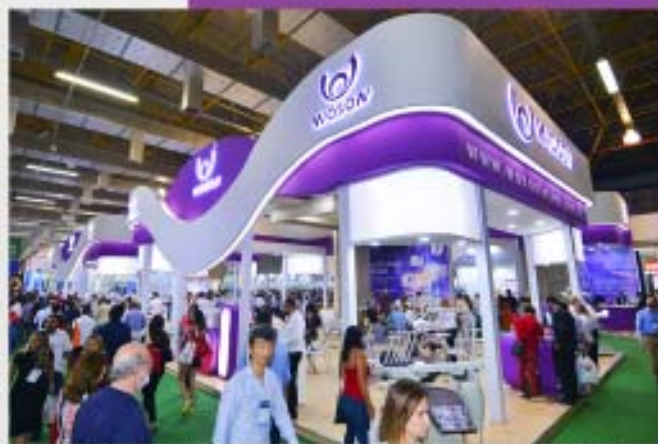
31ª Edição do CIOESP - Congresso Internacional de Odontologia de São Paulo

Em 2017, como parte do projeto de expansão da marca, é fundada a WOSON LATAM no Brasil, as filiais no México, Rússia e Índia, o lançamento do revolucionário modelo TANZO TOUCH 2.0, compatível com o Sistema Purificador de Água por Osmose Reversa (WPS) e a Linha TANVO. Lança-se a TANDA COLOR, uma autoclave gravitacional diferenciada da Classe N, em conformidade com a Norma Internacional EN13060:14 para atender um mercado carente por esterilizadores mais simples, porém de QUALIDADE SUPERIOR, sucesso no mercado latino americano.