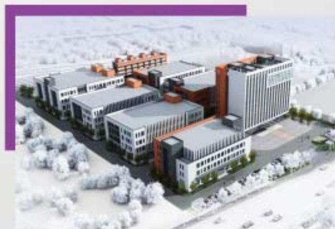
Nova Sede na Ilha de Meishan

Os anos 2018, 2019 e 2020 foram brindados com os lançamentos do consultório odontopediátrico WODO JR, produtos de diagnóstico e imagem, máquina de lavar LINDAR, RX Portátil e de pedestal móvel e parede, inovação da Linha TANZO