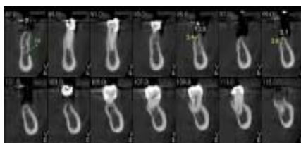
Imagem 2 - (TCFC) Cortes oblíquos da região posterior esquerda da mandíbula, que indicam mensuração vertical e horizontal do rebordo osso alveolar remanescente.

Na imagem 3, visualizamos a região posterior direita da mandíbula com mensuração (em azul) e Traçado Anatômico (em laranja). Enquanto que a imagem 4 refere-se a mesma re