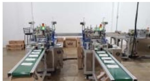
Maquinário na fábrica Providence Medical.

Adquirindo o combo 3, na compra de 4 caixas, ganha uma, cada uma sai por R$ 32,00. Confira no Site os outros combos a escolher.