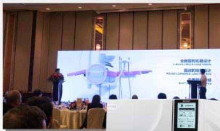
Lançamentos Equipamentos 2020

Os anos de 2011 a 2016 são particularmente importantes com o lançamento da linha TANVO, destilador DRINK e novos modelos de consultórios. Inicia-se a parceria com a empresa americana HUMAN CARE, na área hospitalar, para produção de cadeiras de reabilitação, e a fabricação da linha WOVO. Consolida-se a linha DOLPHINN de esterilizadores básicos. É dado início ao planejamento do Distrito de Jiangbei e estabelecimento de novas metas com os lançamentos das linhas WOVO e WOZO e novos modelos da Linha WODO. Lança-se a autoclave TANZO CLASSIC e se conclui a mudança da planta fabril de Changxing Road para Jinshan Road.