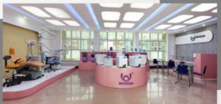
Showroom de Fábrica 2000

Em 2006 lança a pioneira autoclave horizontal de bancada da Linha TANDA, com centenas de unidades vendidas no mercado interno. Também equipamentos de limpeza de instrumentos, fotopolimerizadores, seladoras, destiladoras e lavadoras ultrassônicas.